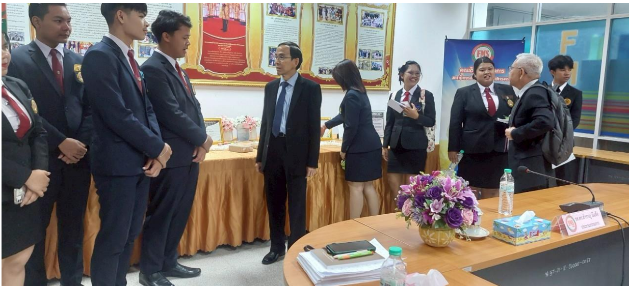
ภาพที่ 4 สัมภาษณ์ผู้แทนชุมชน ผู้ใช้บัณฑิต ศิษย์เก่า และผู้แทนนักศึกษา

รายงานผลการติดตาม ตรวจสอบ และประเมินผลงานของมหาวิทยาลัยราชภัฏมหาสารคาม ประจำปีงบประมาณ 2567