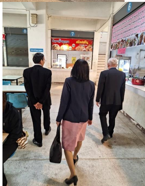
ภาพที่ 7 การตรวจเยี่ยมบริเวณโรงอาหาร

รายงานผลการติดตาม ตรวจสอบ และประเมินผลงานของมหาวิทยาลัยราชภัฏมหาสารคาม ประจำปีงบประมาณ 2567