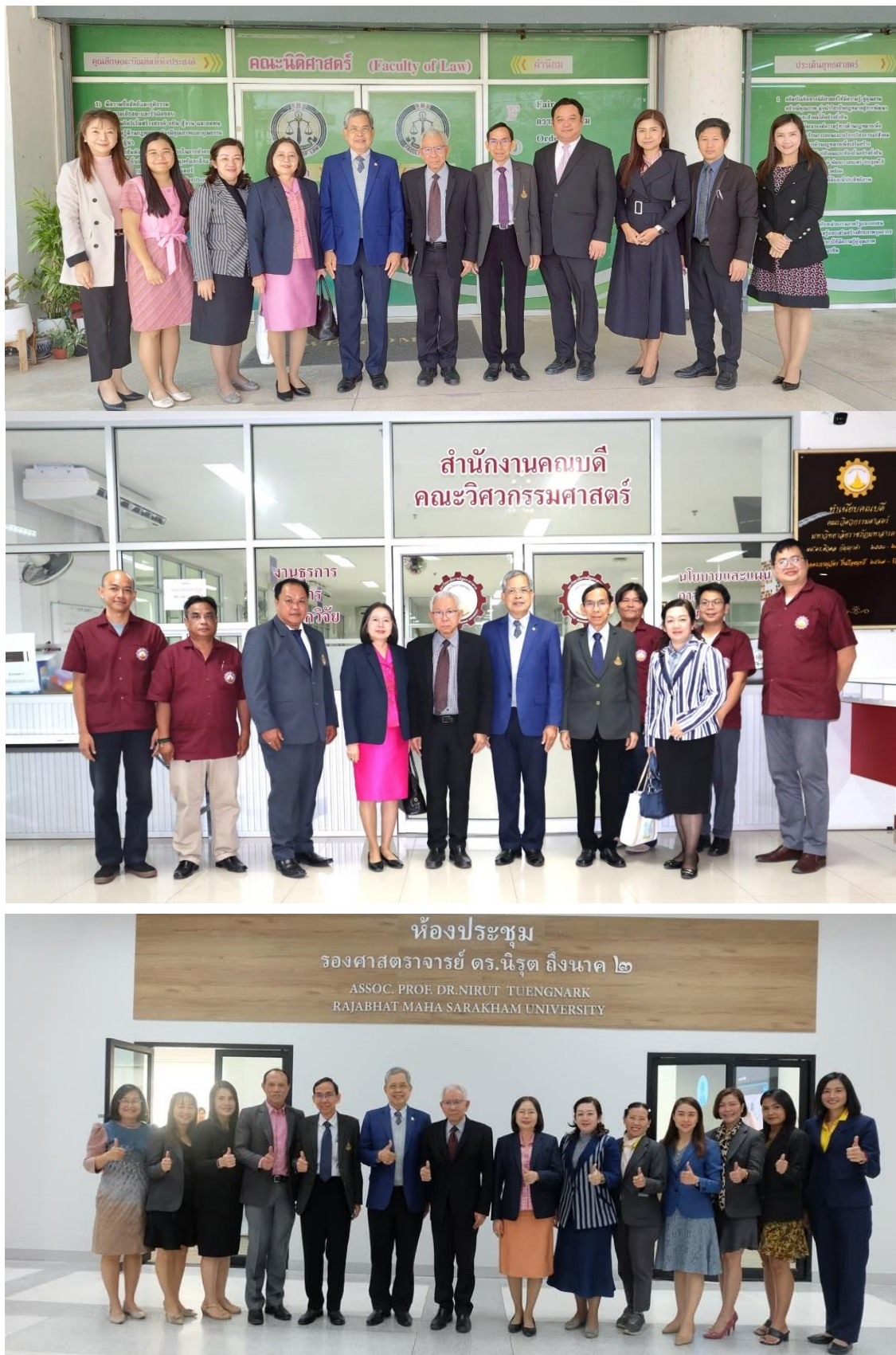
ภาพที่ 1 การตรวจเยี่ยมหน่วยงานระดับคณะ

รายงานผลการติดตาม ตรวจสอบ และประเมินผลงานของมหาวิทยาลัยราชภัฏมหาสารคาม ประจำปีงบประมาณ 2567