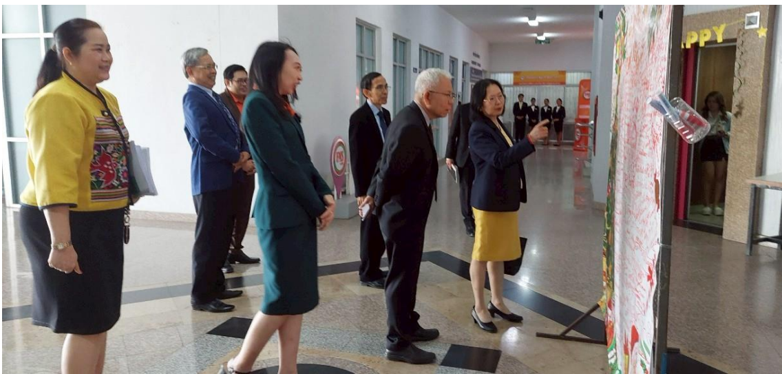
ภาพที่ 2 การตรวจเยี่ยมหน่วยงานระดับสำนัก สถาบัน และโรงเรียนสาธิต (ต่อ)

รายงานผลการติดตาม ตรวจสอบ และประเมินผลงานของมหาวิทยาลัยราชภัฏมหาสารคาม ประจำปีงบประมาณ 2567