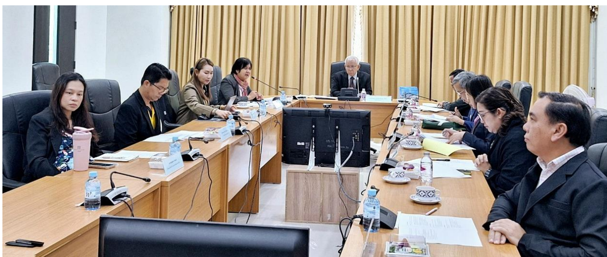
ภาพที่ 1 การตรวจเยี่ยมหน่วยงานระดับคณะ (ต่อ)