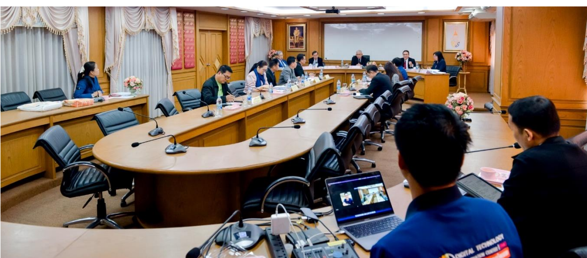
ภาพที่ 3 สัมภาษณ์อธิการบดี รองอธิการบดี และผู้ช่วยอธิการบดี

รายงานผลการติดตาม ตรวจสอบ และประเมินผลงานของมหาวิทยาลัยราชภัฏมหาสารคาม ประจำปีงบประมาณ 2567