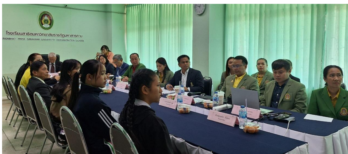
ภาพที่ 2 การตรวจเยี่ยมหน่วยงานระดับสำนัก สถาบัน และโรงเรียนสาธิต

รายงานผลการติดตาม ตรวจสอบ และประเมินผลงานของมหาวิทยาลัยราชภัฏมหาสารคาม ประจำปีงบประมาณ 2567