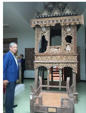
ภาพที่ 5 การตรวจเยี่ยมสำนักศิลปะและวัฒนธรรม