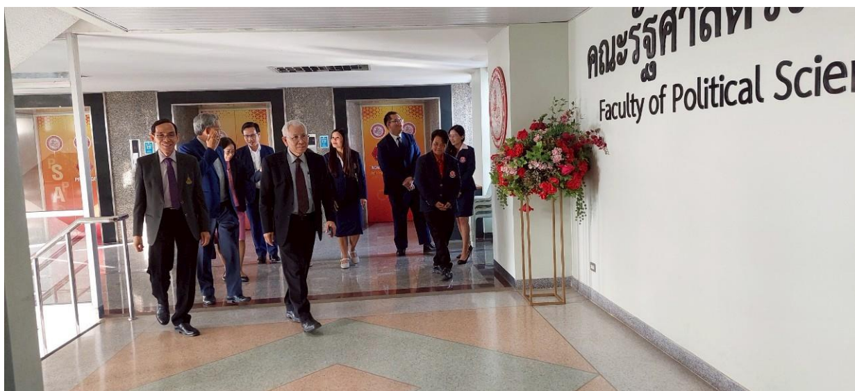
ภาพที่ 6 การตรวจเยี่ยมบริเวณอาคาร สถานที่ และสำนักงาน